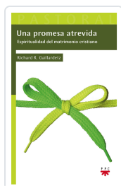
UNA PROMESA ATREVIDA GAILLARDETZ, RICHARD R.