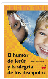
HUMOR DE JESUS Y LA ALEGRÍA DE LOS DISCIPULOS ARENS