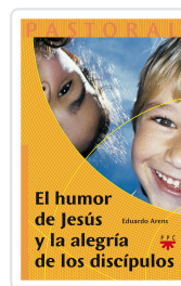
HUMOR DE JESUS Y LA ALEGRIA DE LOS DISCIPULOS ARENS