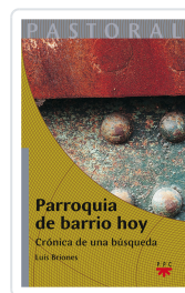
PARROQUIA DE BARRIO HOY BRIONES, LUIS