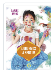
JUGUEMOS A SENTIR! BAYOD SERAFINI