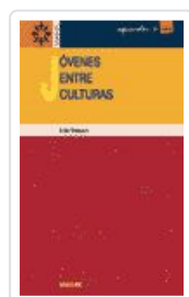
JOVENES ENTRE CULTURAS MASSOT LAFON