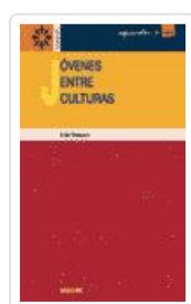
JOVENES ENTRE CULTURAS MASSOT LAFON