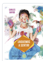
JUGUEMOS A SENTIR! BAYOD SERAFINI