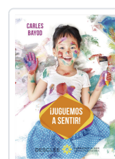
JUGUEMOS A SENTIR! BAYOD SERAFINI