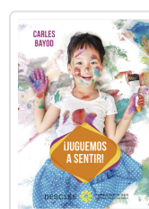
JUGUEMOS A SENTIR! BAYOD SERAFINI