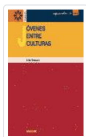
JOVENES ENTRE CULTURAS MASSOT LAFON