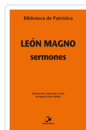
Sermones. Leon Magno nº 139 León Magno