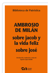
Sobre Jacob y la vida de feliz- Sobre José. nº135 Ambrosio, Santo, Obispo de Milán