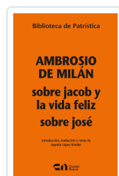
Sobre Jacob y la vida de feliz- Sobre José. nº135 Ambrosio, Santo, Obispo de Milán