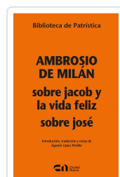
Sobre Jacob y la vida de feliz- Sobre José. nº135 Ambrosio, Santo, Obispo de Milán