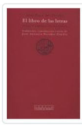
LIBRO DE LAS LETRAS, EL AL FARABI