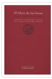
LIBRO DE LAS LETRAS, EL AL FARABI