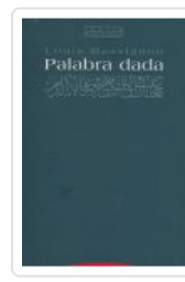
PALABRA DADA MASSIGNON, L