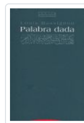
PALABRA DADA MASSIGNON, L