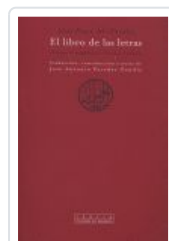
LIBRO DE LAS LETRAS, EL AL FARABI