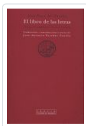
LIBRO DE LAS LETRAS, EL AL FARABI