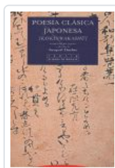
POESIA CLASICA JAPONESA DUTHIE, TORQUIL