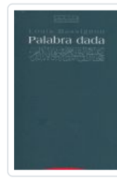
PALABRA DADA MASSIGNON, L