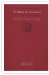
LIBRO DE LAS LETRAS, EL AL FARABI