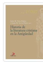
HISTORIA DE LA LITERATURA CRISTIANA EN LA ANTIGUEDAD NIETO IBÁÑEZ, JESUS M / TORRES PRIETO, J