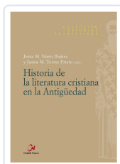
HISTORIA DE LA LITERATURA CRISTIANA EN LA ANTIGÜEDAD NIETO IBÁÑEZ, JESUS M / TORRES PRIETO, J