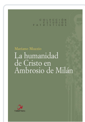
HUMANIDAD DE CRISTO EN AMBROSIO DE MILAN HERNAN MUZZIO, MARIANO