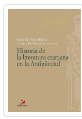
HISTORIA DE LA LITERATURA CRISTIANA EN LA ANTIGÜEDAD NIETO IBÁÑEZ, JESUS M / TORRES PRIETO, J