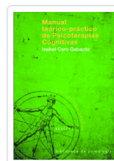
Manual teórico-práctico de Psicoterapias Cognitivas Nº142 Caro Gabalda, Isabel