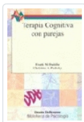
TERAPIA COGNITIVA CON PAREJAS. Nº 73 DATTILIO, FRANK