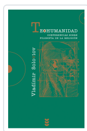
TEOHUMANIDAD SOLOVIOV, VLADIMIR