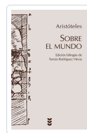
SOBRE EL MUNDO ARISTOTELES