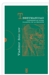
TEOHUMANIDAD SOLOVIOV, VLADIMIR