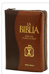
La Biblia. Libro del Pueblo de Dios Levoratti, Armando J. ; Trusso, Alfredo