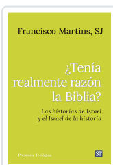
Tenía realmente razón la Biblia? n°321 Martins SJ, Francisco