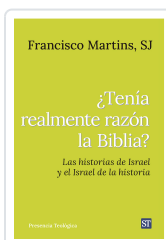
Tenía realmente razón la Biblia? nº321 Martins SJ, Francisco