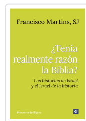
Tenía realmente razón la Biblia? n°321 Martins SJ, Francisco