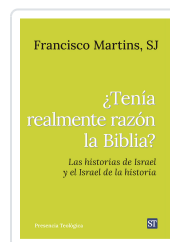
Tenía realmente razón la Biblia? n°321 Martins SJ, Francisco