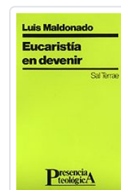
EUCARISTIA EN DEVENIR n°87 MALDONADO, LUIS