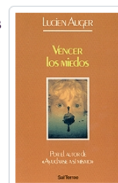
Vencer los miedos nº 35 Auguer, Lucien