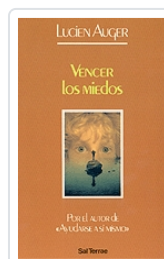
Vencer los miedos nº 35 Auguer, Lucien