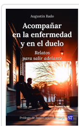
ACOMPANAR EN LA ENFERMEDAD Y EN EL DUELO Nº165 AUGUSTIN BADO