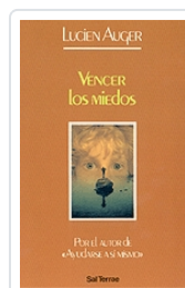
Vencer los miedos n° 35 Auguer, Lucien