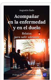
ACOMPañAR EN LA ENFERMEDAD Y EN EL DUELO N°165 AUGUSTIN BADO