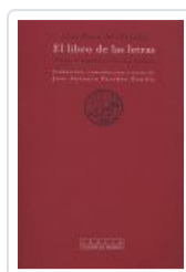
LIBRO DE LAS LETRAS, EL AL FARABI