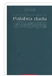
PALABRA DADA MASSIGNON, L