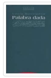
PALABRA DADA MASSIGNON, L