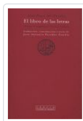
LIBRO DE LAS LETRAS, EL AL FARABI