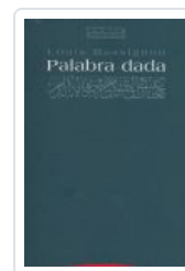
PALABRA DADA MASSIGNON, L