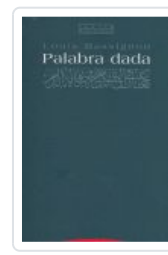
PALABRA DADA MASSIGNON, L