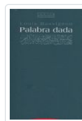
PALABRA DADA MASSIGNON, L