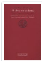
LIBRO DE LAS LETRAS, EL AL FARABI