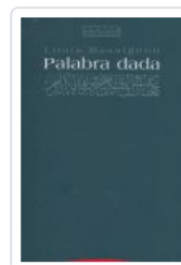
PALABRA DADA MASSIGNON, L