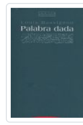
PALABRA DADA MASSIGNON, L