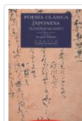
POESIA CLASICA JAPONESA DUTHIE, TORQUIL