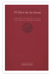
LIBRO DE LAS LETRAS, EL AL FARABI