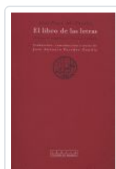
LIBRO DE LAS LETRAS, EL AL FARABI