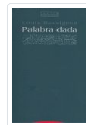
PALABRA DADA MASSIGNON, L