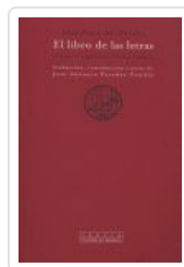
LIBRO DE LAS LETRAS, EL AL FARABI