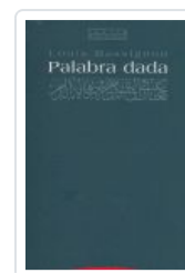
PALABRA DADA MASSIGNÓN, L