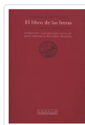
LIBRO DE LAS LETRAS, EL AL FARABI