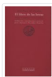
LIBRO DE LAS LETRAS, EL AL FARABI