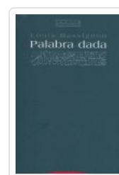
PALABRA DADA MASSIGNON, L