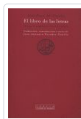
LIBRO DE LAS LETRAS, EL AL FARABI