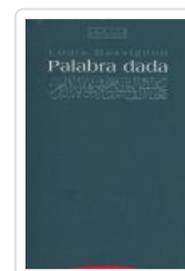
PALABRA DADA MASSIGNON, L