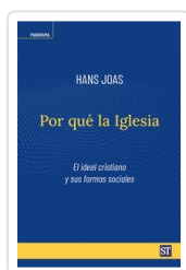
POR QUE LA IGLESIA JOAS, HANS