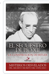
SECUESTRO DE PIO XII, EL DAL BELLO, MARIO