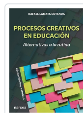
Procesos creativos en educación Rafael Lamata Cotanda