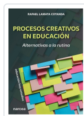
Procesos creativos en educación Rafael Lamata Cotanda