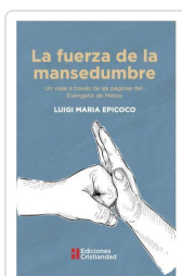
LA FUERZA DE LA MANSEDUMBRE LUIGI MARIA EPICOCO