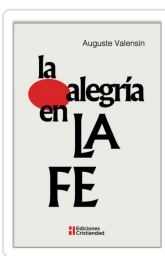
LA ALEGRÍA EN LA FE AUGUSTE VALENSIN