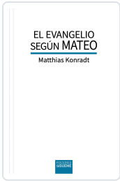
El evangelio según Mateo Nº179 Matthias Konradt