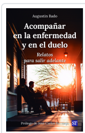
ACOMPÑAR EN LA ENFERMEDAD Y EN EL DUELO Nº165 AUGUSTIN BADO