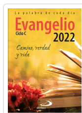
EVANGELIO 2022 (SP) EQUIPO SAN PABLO