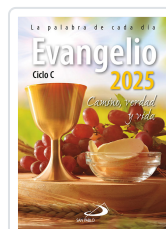
EVANGELIO 2025 (SP) AA.VV.