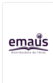
EVANGELIO 2023 (SP) EQUIPO SAN PABLO