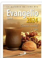
EVANGELIO 2024 (SP) SPABLO