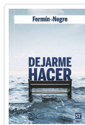
DEJARME HACER nº 183 NEGRE, FERMIN